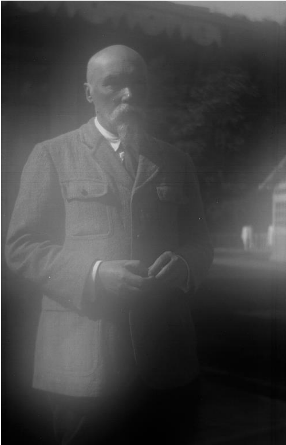
Н. К. Рерих. Дарджилинг. Индия. Июнь-октябрь 1928 Собрание Музея Николая Рериха в Нью-Йорке